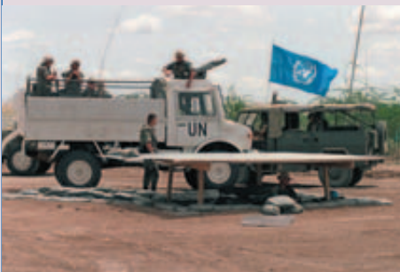
Deutsche UN-Soldaten in Somalia