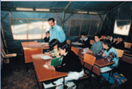
Klassenzimmer in Bare/Mitrovica