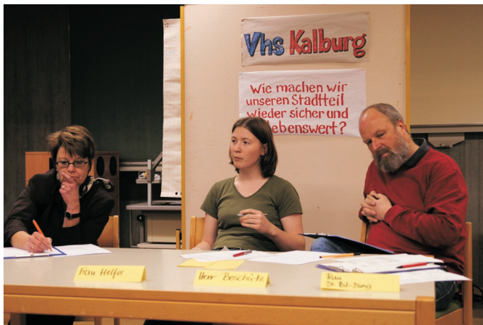
Rollenspiel im Kurs: Podiumsdiskussion zur Frage "Wie machen wir unseren Stadtteil wieder sicher und lebenswert?"