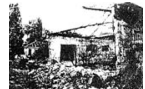
Khulda (Ramla): Ein Haus ist verlassen, das andere zerstört.