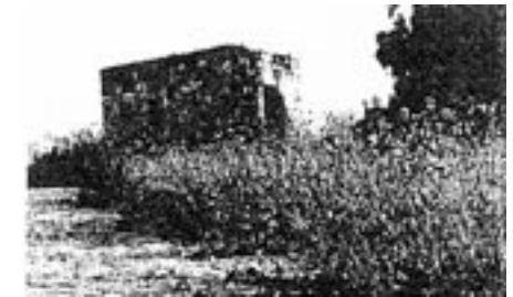
Verlassene Häuser in Kufr Lam (Haifa)