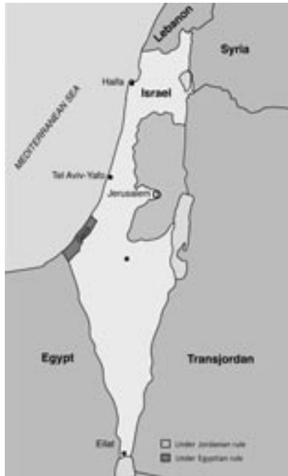
Karte: Waffenstillstandslinien nach dem Unabhängigkeitskrieg. Diese bildeten bis 1967 die Grenzen Israels.