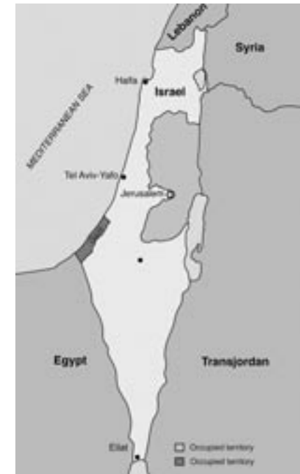
Karte: Karte von Palästina vor dem Sechs-Tage-Krieg 1967

Artikel 11 der UN-Resolution 194 vom Dezember 1948 19 legte fest, dass denjenigen Flüchtlingen, die zu ihren Wohnstätten zurückkehren und in Frieden mit ihren Nachbarn leben wollten, dies zum frühestmöglichen Zeitpunkt gestattet werden sollte und dass für das Eigentum derjenigen, die sich entscheiden, nicht zurückzukehren sowie für den Verlust oder die Beschädigung von Eigentum, auf der Grundlage internationalen Rechts oder nach Billigkeit von den verantwortlichen Regierungen und Behörden Entschädigung gezahlt werden soll.