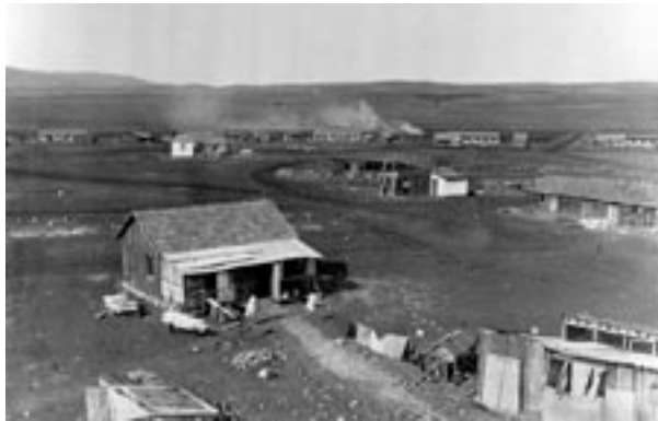
Foto: Der Moschaw Nahalal, eine genossenschaftlich organisierte landwirtschaftliche Siedlung, wurde 1921 im Jesreel-Tal gegründet.