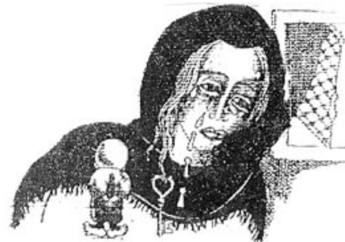
Aus den Zeichnungen von Naji al-Ali

Die Palästinenser hatten dabei allerdings nicht den geringsten Zweifel, dass dieser Exodus nur ein paar Tage dauern und sie danach wieder heimkehren würden. „Wir dachten, wir würden nach ein, zwei Wochen nach Hause zurückkehren. Wir verriegelten das Haus und behielten den Schlüssel und warteten auf die Heimkehr.“