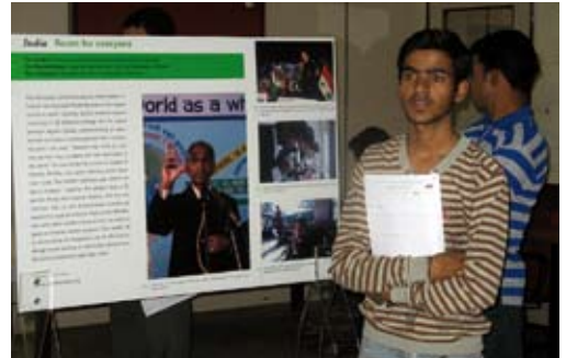
Workshop-Teilnehmer, New Delhi, 2009.