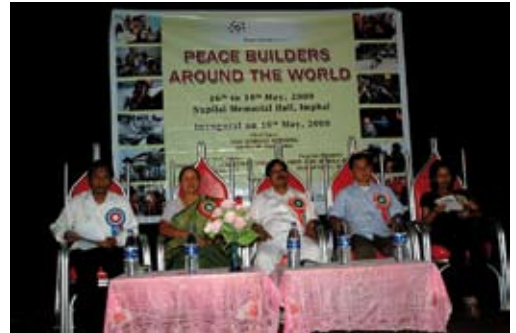
Eröffnungsveranstaltung in Imphal, 2009.

14. Insgesamt nahmen 42 MultiplikatorInnen an zwei ToT-Workshops (März 2009 und August 2009) in Neu Delhi teil. Alle arbeiten in Einrichtungen, deren Zielgruppen wichtige Akteure für Konfliktbearbeitung und Friedensprozesse sind: MitarbeiterInnen von Menschenrechtseinrichtungen, FriedenspädagogInnen, HochschuldozentInnen, Studierende einer freiwilligen