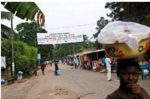
Werbung für die Ausstellung, Abidjan 2008.