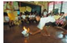
13 A child in the Peace Zone helped an Christian record pictures of the village members. Now they don't fight in the future.