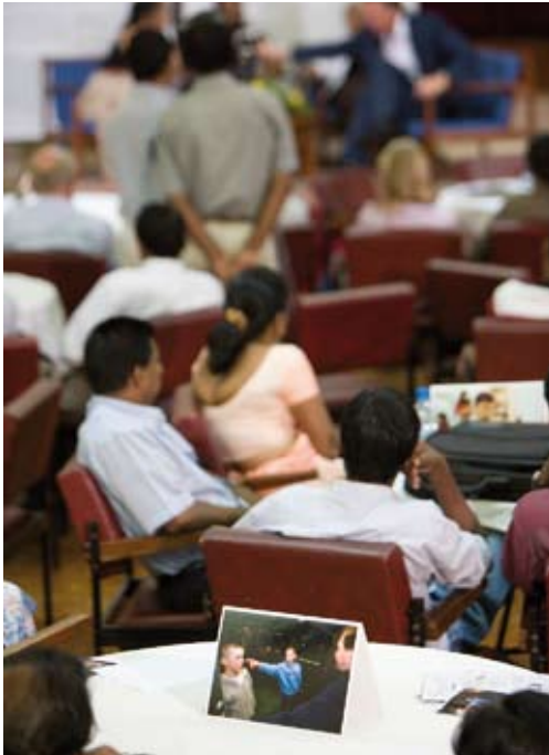
Tischkarten bei Eröffnungsveranstaltung, Colombo, 2007.

Bildung neuer Kooperationen und Allianzen vor Ort schultern. Ob in Davao City (Philippinen) oder in Bogota (Kolumbien): Je größer der Problemdruck und je ungewöhnlicher die Kooperationen desto intensiver die Vorbereitungsphase und desto rascher übernahmen die Partner vor Ort einen großen Teil der Verantwortung und machten sich „Peace Counts on Tour“ zum eigenen Projekt.