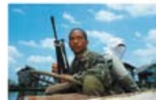
12 Peace zones are being and still are much better to follow the path to end the armed struggle. Muslim separatists on the island of Mindanao have been forced to withdraw their forces for the moment.