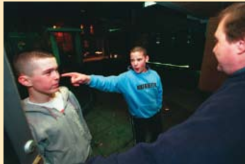
Nordirland „Jugendarbeit unterbricht die Gewaltspirale“