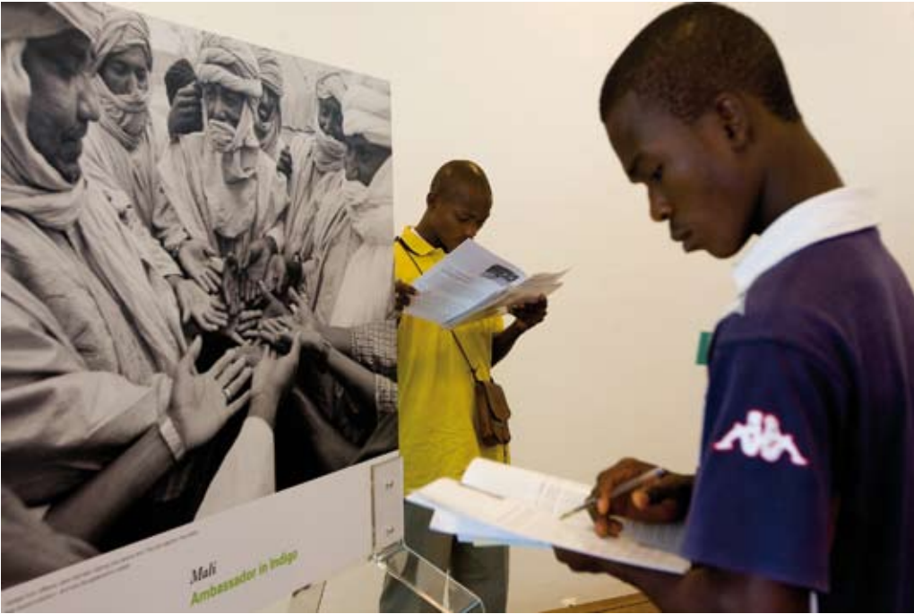
Austellungsbesucher in Abidjan, 2008.