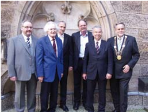
Verteter der Universität, Laudator, Preisstifter und Preisträger.

Projekte nicht konterkariert oder gar regelrecht bekämpft?