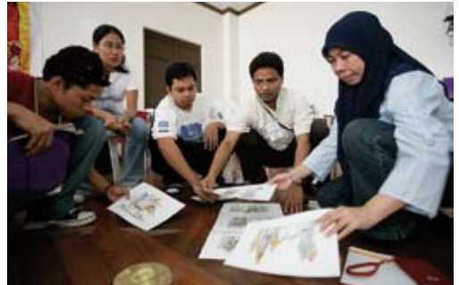
Workshop in Davao City, 2008.

Museo Dabawenyo eine „Peace Counts Hall“ zu etablieren. Dieses Vorhaben konnte umgesetzt werden: Ein Saal im ersten Stock zeigt heute (in Nachproduktion) große Teile der Ausstellung. Eine Weltkarte stellt die Friedensarbeit auf den Philippinen in einen Zusammenhang mit vergangenen und zukünftigen Stationen von „Peace Counts on Tour“. In einem Regal ist eine Sammlung von Büchern über Frieden und die Geschichte Mindanaos verfügbar. Speziell angesichts der politischen Lage in Mindanao ist eine so exponierte Präsentation unter dem Stichwort „Wie man Frieden macht“ von großem Wert. Nachfragen haben ergeben, dass sich auch die über „Peace Counts on Tour“ etablierte Friedensallianz in Krisenzeiten bewährt hat.