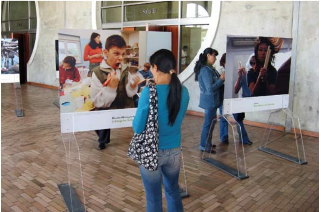
Ausstellung in Bogotá, 2009.

finden sind. Über die Geschichte der Ex-Terroristen in Nordirland entstand eine rege Diskussion, da in Kolumbien der Prozess der Demobilisierung der Paramilitärs in vollem Gange ist und die Frage aufwirft, ob und wie diese Menschen sich wieder in das zivile Leben integrieren können. Auch in den Workshops mit den Schülerinnen fand diese Geschichte großen Anklang. Die Biographien der beiden Nordiren zeige ihnen, dass auch Mörder das Potenzial hätten, ihr Leben zu ändern und für den Frieden einzutreten.