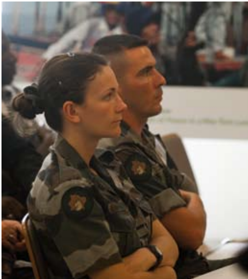
Gäste der UNO-Truppe bei der Ausstellungseröffnung in Abidjan, 2008.

Die TeilnehmerInnen wurden vom Goethe-Institut gezielt ausgesucht und eingeladen. Sie kamen aus allen Teilen des Landes. Männer und Frauen bzw. Mädchen und Jungen waren ungefähr gleich stark vertreten. Viele der SchülerInnen zeichneten sich durch ein hohes Engagement in sogenannten Friedensdörfern aus. Dies sind Gruppen an Schulen, die sich mit dem Thema Frieden befassen.