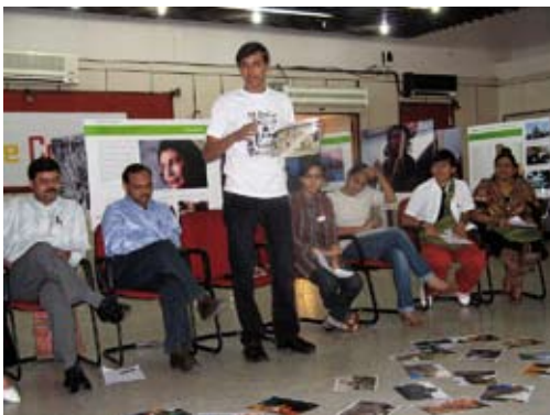
Workshop in New Delhi, 2009.

7. Nach dem ToT führten die TeilnehmerInnen eigene Projekte in ihren Städten und Regionen durch. Die Mitglieder des „Peace Counts Team India“ adaptierten die Inhalte der Workshops entsprechend der Zielgruppen und Ressourcen. So führten alle einen Teil der Module von „Peace Counts on Tour“ durch (Conflict Escalation and De-escalation, How to be a peacebuilder, Best Practice-Beispiele). Einige Module wurden nicht durchgeführt, was teilweise am Mangel an Material lag und teilweise, weil die Teams eigene, ihrer Situation angepasste Methoden (Konfliktanalyse, Peace Games etc.) eingebunden hatten. Eine solche spezifische Adaption