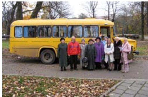
Ankunft von Workshop-TeilnehmerInnen in Kaliningrad, 2008.

1. Nach der Begrüßung steht am Beginn der Workshops zunächst ein Rundgang durch die Ausstellung. Zuvor bekommen die TeilnehmerInnen ein Handout mit allen Texten der Ausstellung in Landessprache bzw. Landessprachen (so z. B. Sinhala/Tamil in Sri Lanka oder Mazedonisch/Albanisch in Mazedonien) sowie ein Arbeitsblatt mit Leitfragen