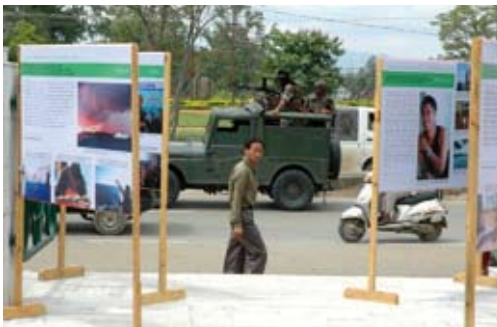
Ausstellung in Manipur, 2009.

Weitere Ergebnisse: Einrichtung einer Facebook-Gruppe; Produktion einer Film-DVD (deutsch und englisch).