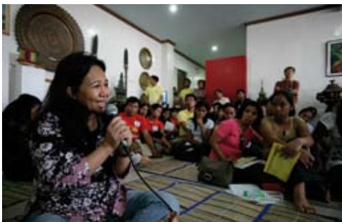
Story-Telling in Davao City, 2008.

Nachhaltigkeit: Als ein herausragendes Indiz für „Local Ownership“ kann der Wunsch der Partner vor Ort interpretiert werden, im