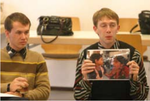
„Mein Friedensfoto“: Workshop in Kaliningrad, 2008.

Partnerorganisation in Sri Lanka auch zwei Jahre nach Ende des Projektes mitten im umkämpften Norden des Landes Workshops mit den genannten Materialien durchgeführt. In Davao City (Philippinen) wurde sogar eine Peace Counts Hall etabliert und in Indien die Ausstellung mehrfach nachproduziert.