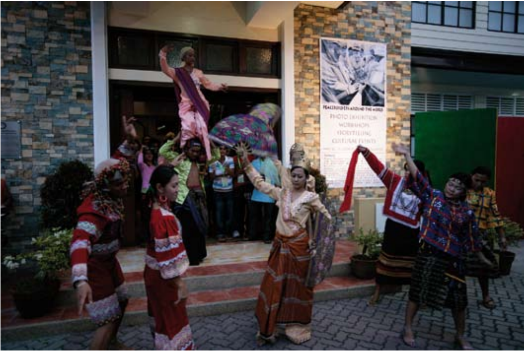
Ausstellungseröffnung mit der Gruppe Kaliwat in Davao City, 2008.