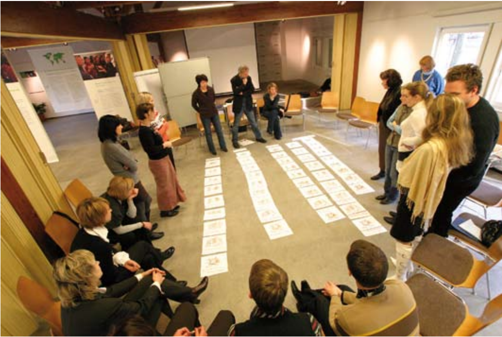
Wie eskalieren Konflikte? Workshop in Kaliningrad, 2008.

Aus anderen Stationen kommen ähnliche Rückmeldungen. Drei herausragende Beispiele seien genannt: