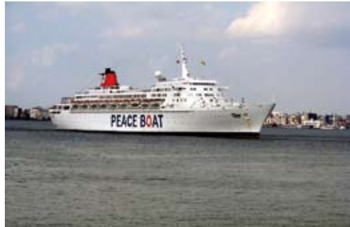
Das Peaceboat im Hafen von Izmir, 2009.

Peace Counts managed to build up an excellent new methodology in working with grass-roots and schools, which has shown obvious success. This methodology could still be developed and bring out more practical tools for partici-