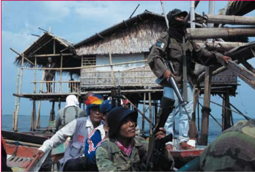
10 In the wake of the typhoon, a displaced boat arrived this morning on an evacuation from the coastline. Soldiers, civilians and government workers on display and buildings, the image captures the progress of peace established by the army in the area. A captured image from the Philippines.