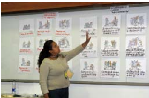
Teilnehmerin eines Workshops in Bogotá, 2009.

Zentral war für die TN zudem die Empathie mit dem Gegenüber. Obwohl fast alle TN darin übereinstimmten, dass Empathie generell wichtig sei, hielten viele es für sehr schwer bis unmöglich, Empathie mit kolumbianischen Rebellen, Paramilitärs oder Armeemitgliedern zu empfinden. Allerdings gab es auch die Anmerkung, dass viele Menschen unter Zwang den bewaffneten Gruppen beitreten und somit auch Opfer seien, die Empathie verdienten. Wichtig war den TN zudem, über den Konflikt Bescheid zu wissen. Dabei wurde oft die Schwierigkeit diskutiert, an ausgewogene Informationen über den Konflikt in Kolumbien zu gelangen, da die Medien von wenigen regierungsfreundlichen Familien dominiert würden. Eine wichtige Informationsquelle