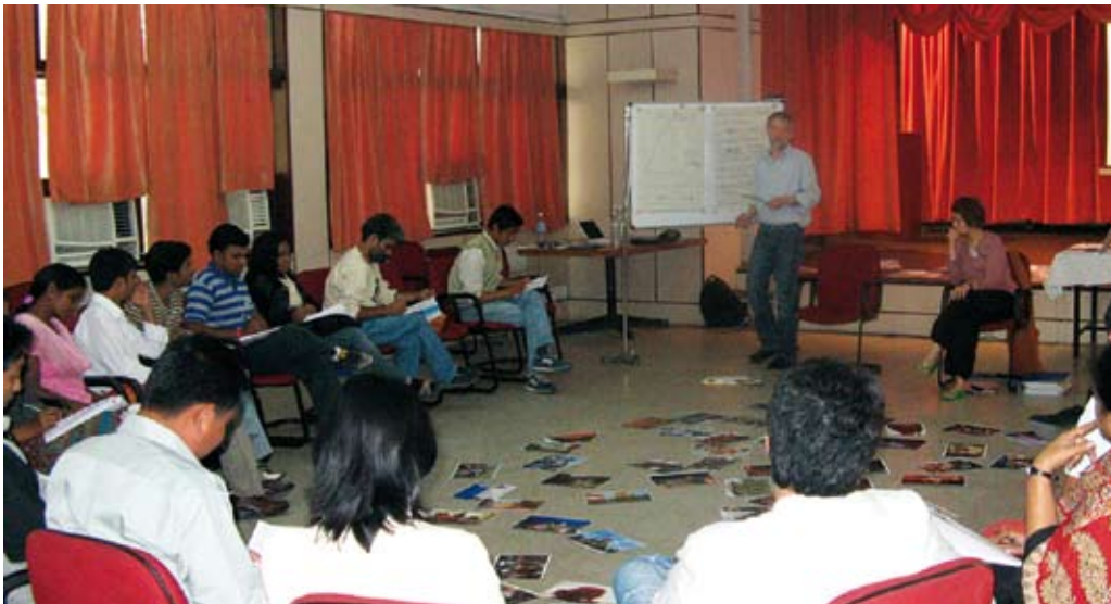
Workshop in New Delhi, 2009.

wendungen, aber bei entsprechenden Gelegenheiten und Partnern kann ein solches Modell sehr zur Nachhaltigkeit beitragen. In Indien, als eines der bevölkerungsreichsten Länder der Welt, wo nahezu alle Religionen vertreten sind und viele verschiedene Konfliktlinien in der Gesellschaft verwurzelt sind, war ein solches Training-of-Trainers ideal. Gerade auch, weil unterschiedliche Bundesstaaten und Regionen des Landes, aber eben auch unterschiedliche Zielgruppen erreicht werden sollten, wurden zwei Workshops angeboten, mit dem Ziel dass deren TeilnehmerInnen „Peace Counts on Tour“ mitsamt der Ausstellung und dem Workshopprogramm in ihre Einrichtung bringen und ihre Zielgruppen zur Teilnahme einladen. Die Evaluationsphase diente dazu, zum einen zusätzliche inhaltliche Inputs für die MultiplikatorInnen des ToT I zu geben, darüber hinaus aber vor allem das neue Format zu überprüfen und zur Optimierung beizutragen. Das ToT II wurde entsprechend der Ergebnisse des Evaluationsworkshops angepasst.