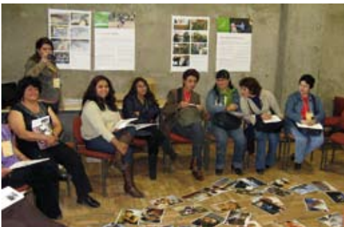
Workshop in Bogotá, 2009.