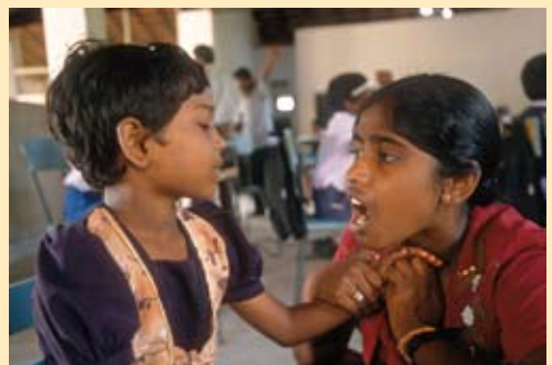
Sri Lanka „Frieden durch Sprache“