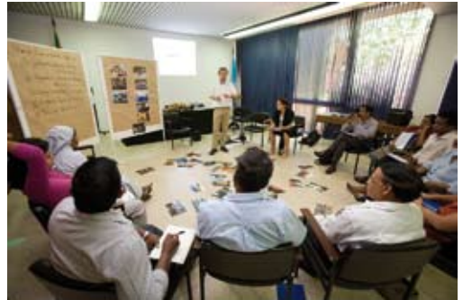
Was ist Frieden? Workshop in Colombo, 2007.

3. Für das Modul „Best Practice-Beispiele für Friedensstiftung“ sind unterschiedliche, kontextbezogene Pfade möglich: Die Vertiefung einzelner Peace Counts-Reportagen ist ein