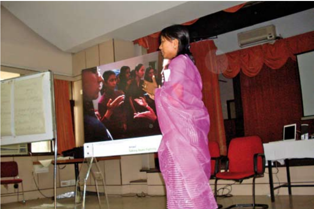
Workshop in New Delhi, 2009.

Rajasthan (geplant): Ausstellung in Hindi und 1-Tages-Workshop.