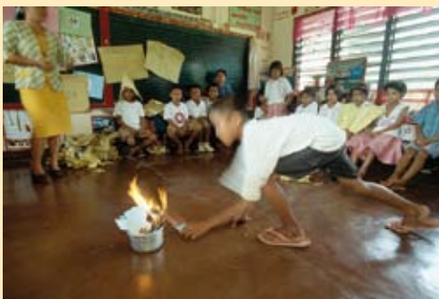
Philippinen „Symbolische Verbrennung von Gewalterfahrungen“