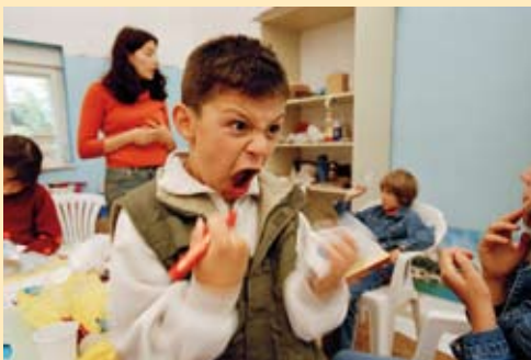
Bosnien-Herzegowina „Anti-Aggressionstraining zur Bearbeitung von Kriegstraumata“