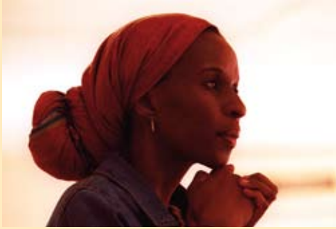
Südafrika „Innerer Frieden“