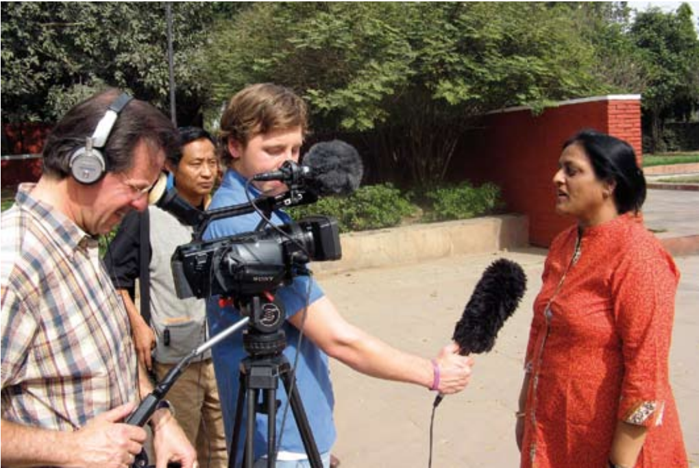
Interview mit einer Teilnehmerin des Workshops in New Delhi, 2009.

„Ownership“ für die Durchführung eigener Peace Counts Projekte übernehmen, d.h. dass die Partner die Ausstellung „Peacebuilders Around the World“ zeigten und dazu mehrtägige Workshops mit ihren Zielgruppen durchführten und hoch motiviert waren. Es wurde deutlich, dass „Peace Counts on Tour“ ein in höchstem Maße erwünschtes Projekt war. Denn zum einen waren die Präsentationen beim Evaluationsworkshop von sehr viel Motivation geprägt und zum anderen lässt der Wunsch vieler Gruppen auf eine Weiterarbeit darauf hindeuten. Der intensive Kontakt zu nahezu allen TeilnehmerInnen beider ToTs (mit Ausnahme der peripheren Gebiete, wie Orissa) mit den Projektverantwortlichen und der rege Austausch in Indien durch den Kontakt zu INSAF zeigt, dass sich viele bereits stark mit Peace Counts identifizieren. Dadurch dass die TeilnehmerInnen der ToTs im Zentrum der Workshops standen