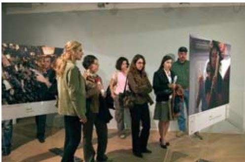
AusstellungsbesucherInnen in Skopje 2007.

Nachhaltigkeit: Leider war das Ownership beim Partner OSZE aufgrund Überlastung nicht sehr ausgeprägt; wenig Kontakte nach Projektende.