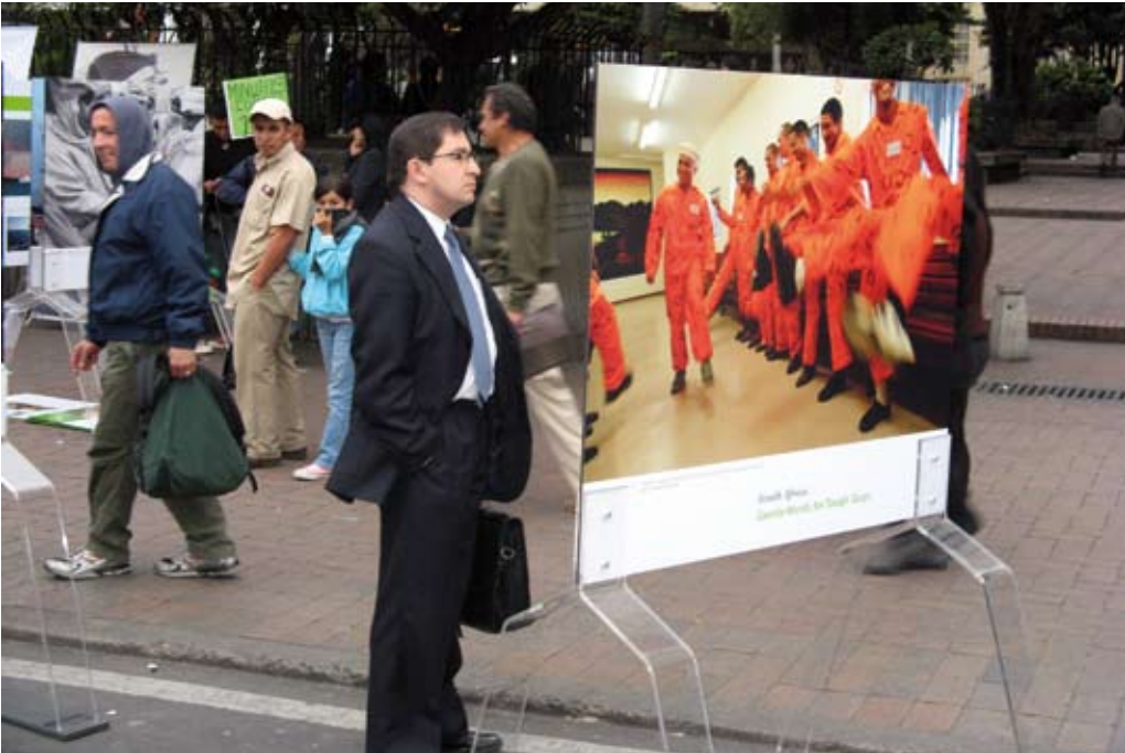
Ausstellungspräsentation im Freien in Bogota, 2009.