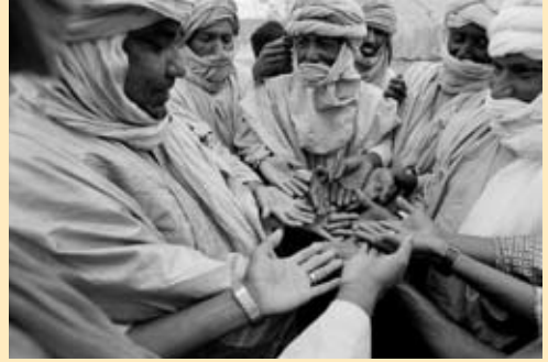
Mali „Friedensgeste symbolisiert Frieden“