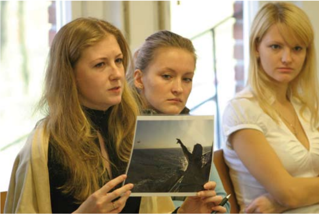
Workshop-Teilnehmerinnen in Kaliningrad, 2008.