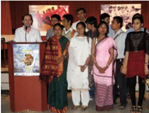
Eröffnungsveranstaltung in New Delhi, 2009.

nicht der Qualität der Originalausstellung. Die Option der Nachproduktion ist vor allem für den ToT-Ansatz interessant.