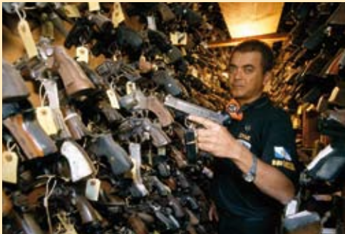
Brasilien „Entwaffnung bringt ein Mehr an Sicherheit“