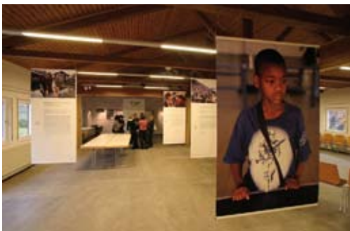
Banner-Fassung der Ausstellung in Kaliningrad, 2008.

Kurzkommentar: Eine intensive gesellschaftliche Auseinandersetzung mit Themen wie Krieg und Frieden, Konflikt und Gewalt ist für die im Kaliningrader Gebiet lebenden Menschen von großer Bedeutung: Trotz erheblicher positiver Entwicklungen sind die Stadt und vor allem das ländliche Gebiet der Oblast weiterhin für viele Menschen geprägt von Armut und Perspektivlosigkeit. Die Folgen für Kinder und Jugendliche sind drastisch. In einem Bericht der Netzzeitung „Kaliningrad aktuell“ vom März 2008 heißt es zum Beispiel: „In vielen Familien grassiert Alkoholismus, herrscht Gewalt. Nur in den schlimmsten Fällen, wenn die Familie für das Kind zur Lebensgefahr wird, entziehen die Sozialämter den Eltern das Sorgerecht und bringen die Kinder in einem Heim unter.“ Verwahrlosung und häusliche Gewalt stellen nicht nur die MitarbeiterInnen der sozialen Einrichtungen