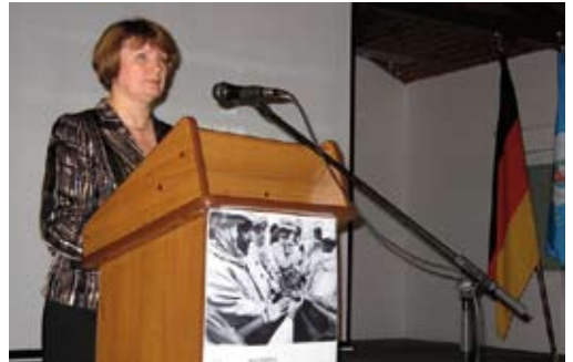
Irina F. Werschchina, Ombudsfrau der Oblast Kaliningrad, 2008.

vor große Probleme, sondern auch das Lehrpersonal an Schulen. Dieser Sachverhalt und die fehlenden Plattformen für den Erfahrungsaustausch im Umgang mit Konflikt- und Gewaltpotenzialen machten Kaliningrad als Station von „Peace Counts on Tour“ zu einer besonderen friedenspädagogischen Herausforderung.