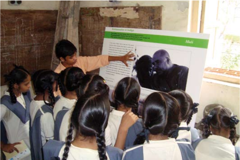
Schülerinnen des Samarth Junior Colleg in Mumbai, 2009.