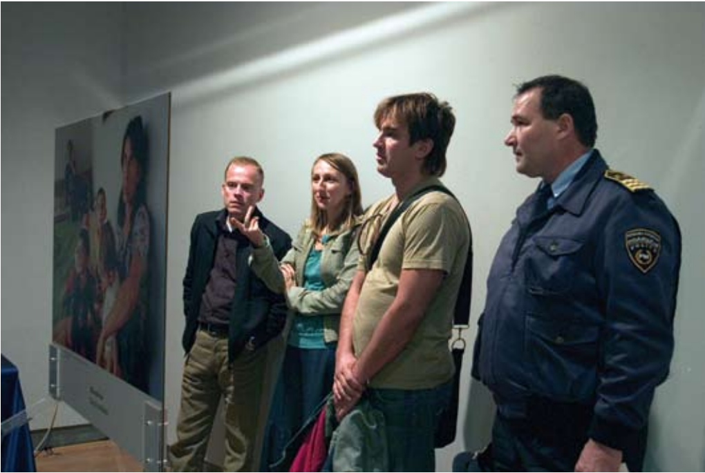
Workshop in Skopje, 2007.