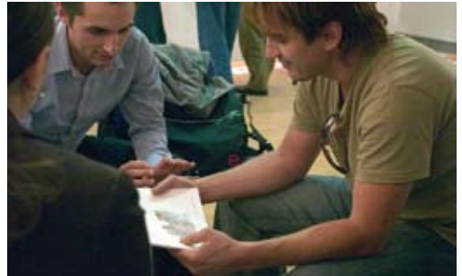
Workshop in Skopje, 2007.