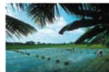
14 During the war, many lost their lives and families. In the Peace Zone of Mindanao, Christians and Muslims have now built together again in peace.