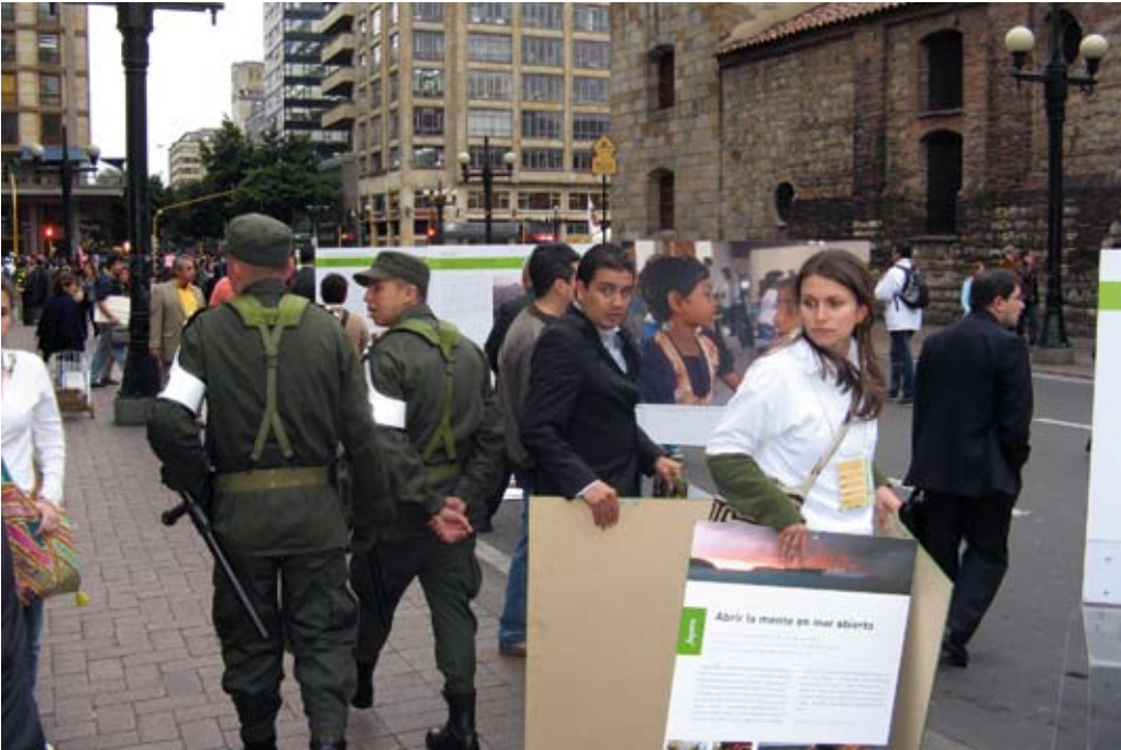
Die Ausstellung „Peacebuilders Around the World“, aufgebaut auf einer Hauptstraße in Bogotá, 2009.

teure Zollabwicklung zu vermeiden, den Druck des Ausstellungshandouts zu sparen und zudem noch mal attraktiver für das Laufpublikum zu sein, das vielleicht von den englischen Tafeln zu schnell abgeschreckt wurde. Außerdem könnte die Ausstellung so nach Abschluss des Projekts in Kolumbien bleiben und im Sinne der Nachhaltigkeit von den Partnern selbständig weiter verwendet werden.