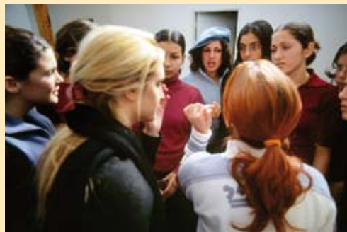
Israel / Palästina „Dialog überwindet verhärtete Fronten“