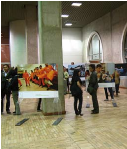
Ausstellung in Bogotá, 2009.

Die Partner vor Ort waren äußerst gut organisiert und sehr hilfsbereit. Sie beeindruckten mit professionell produzierten Plakaten, Broschüren und Lesezeichen zu Peace Counts und weißen T-shirts mit Logo für alle HelferInnen und die Mitglieder des Peace Counts on Tour Teams. Sie kümmerten sich um sämtliche logistische Fragen, organisierten den Aufbau der Ausstellung in der Bibliothek und die kurzzeitige Verlegung der Ausstellung in die Innenstadt. Während der Workshops stellten sie die notwendige Technik (Beamer, Laptop) und die Workshopmaterialien bereit. Sie füllten Teilnehmerlisten aus, erstellten