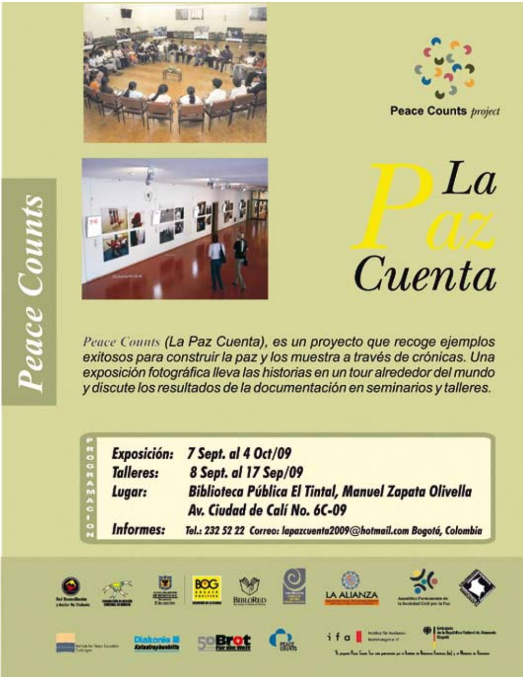
Einladungsplakat, Bogotá, 2009.