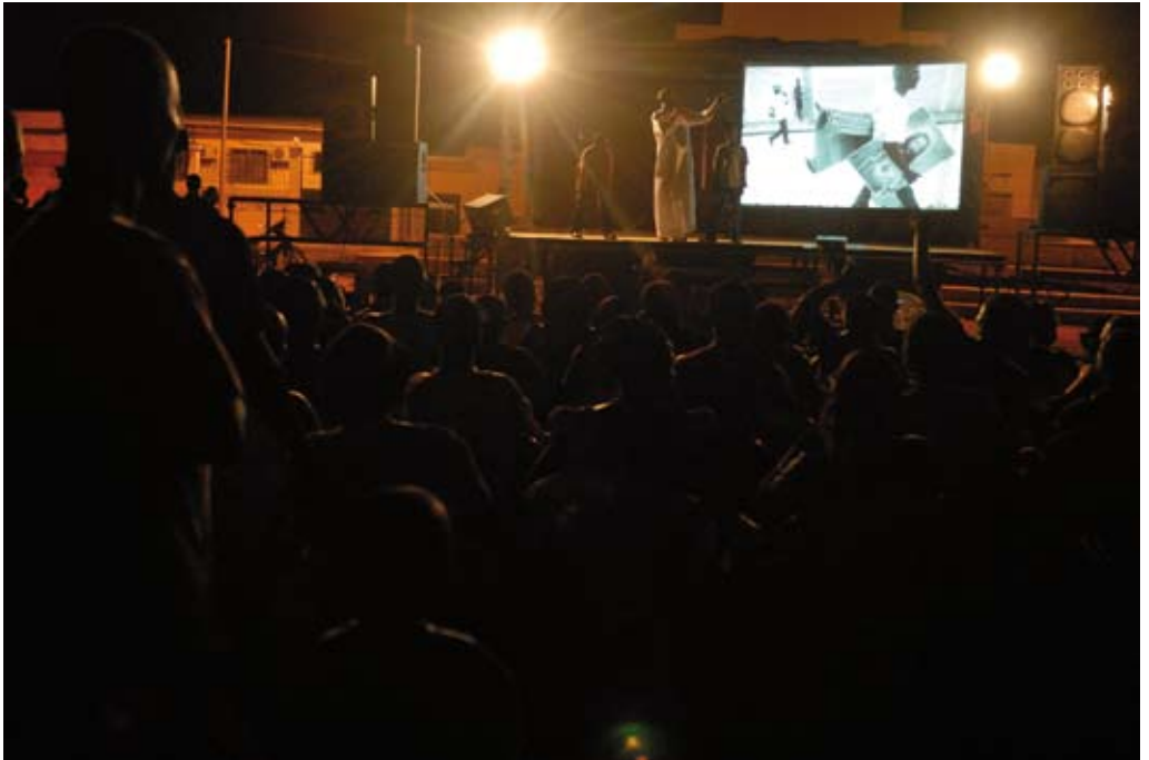
„Peace Counts en Côte d'Ivoire“, 2009.

Fortunés Augen wurden groß bei diesen Sätzen, sein Blick starr und intensiv.